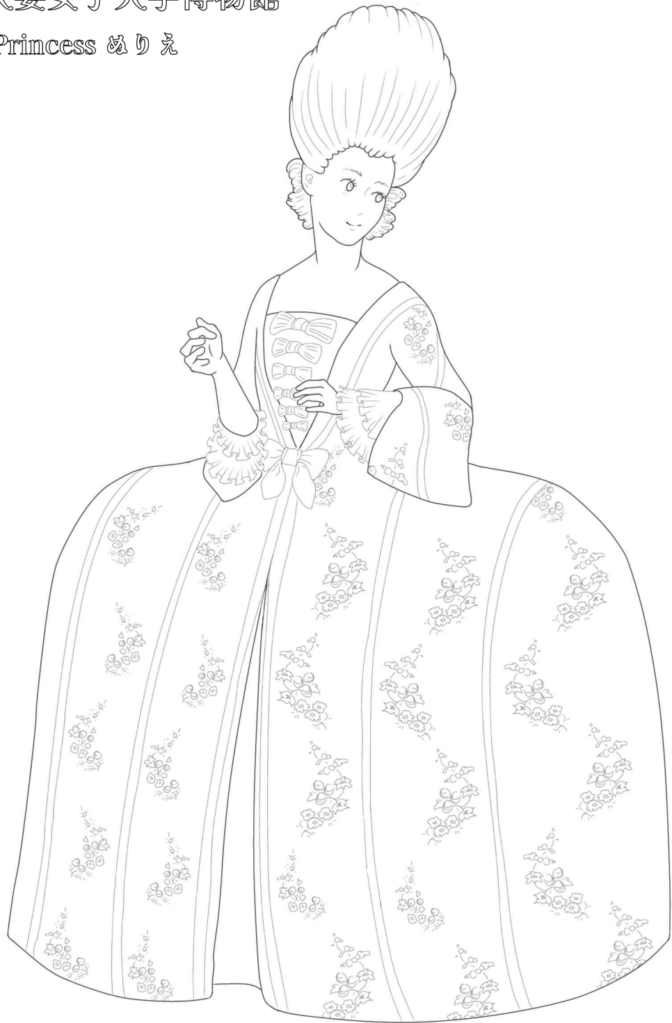
ロココ・スタイル (Rococo Style)のドレス(復元・1987年)