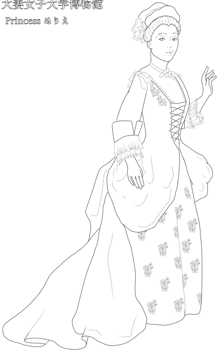
仮装舞踏服(復元・1982年)