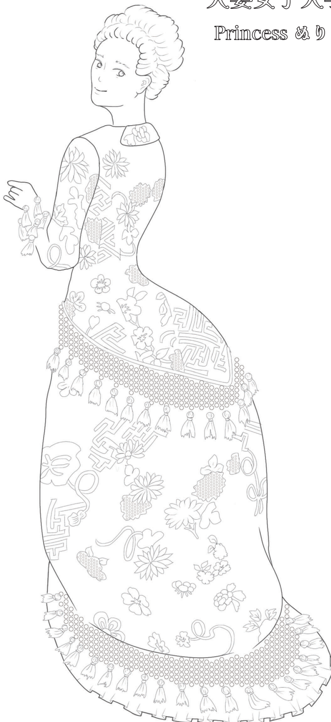
白綸子地紗綾形唐団扇花束模様小袖夜会服（復元・1983年）